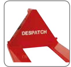
Nimi, logo tai muu teksti voidaan polttoakaivertaa päätykolmioon taikka vaunu voidaan toimittaa erityisen värisenä.