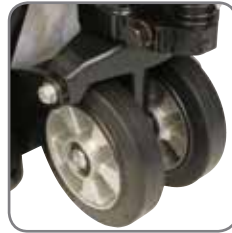
Erikoiskumiset pyörät ovat hellävaraiset lattioille ja laattapinnoille.