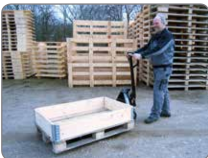
Panther Silentia voit käyttää myös ulkona. Metallilastut, pikkukivet lumi jne. eivät tartu pyöriin.