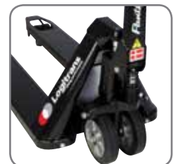
Panther Silentissa on pikanosto vakiona.