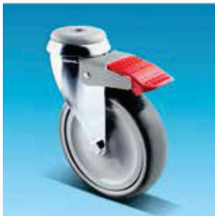
27 Kuulalaakeroitu pyörä