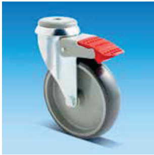
26 Liukulaakeroitu pyörä