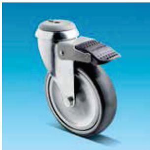
28 Kuulalaakeroitu pyörä